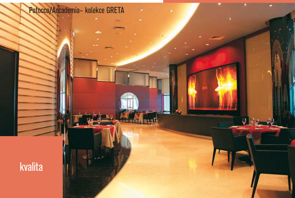
Potocco/Accademia- kolekce GRETA