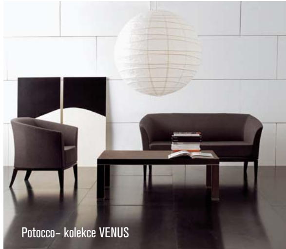
Potocco- kolekce VENUS

praktické, ale také esteticky vyvážené. Selva Hospitality je světově uznávaná značka z několika důvodů: zařizování hotelů v nejvyšší kvalitě, perfektní služby a fascinující design jedinečných atypických kusů na zakázku pro malé rodinné hotely až po kompletní management projektů včetně návrhu interiérů v projektech velkého rozsahu. Selva Hospitality je zárukou řešení šitých na míru, profesionálního know-how, nejmodernější logistiky, nápaditých řešení